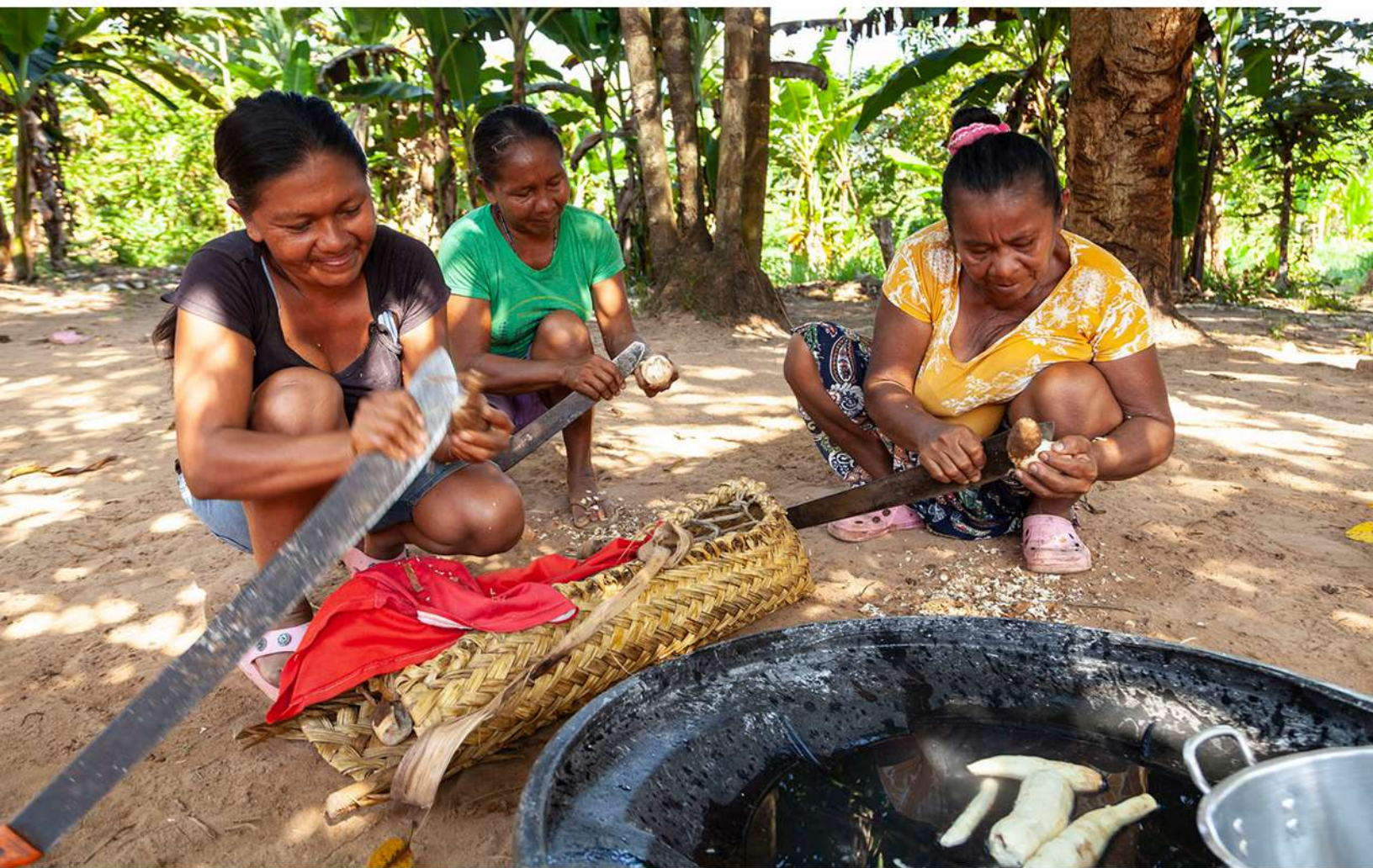
Imagen 5 Mujeres Piapoco en el resguardo indígena de Guaco Alto. Cumaribo, 2020.

El piloto de Cumaribo, en el departamento de Vichada, fue una excepción. La gran mayoría, alrededor del 80% de los pobladores, son indígenas. Uno de los grupos étnicos es el Sikuani, caracterizado culturalmente por designar los roles de liderazgo a los hombres. Suelen encargarse de labores como el liderazgo de la tribu, seguridad, etc. Las mujeres, en cambio, se dedican a labores domésticas. Cosechan, transportan, preparan y cocinan yuca mientras se encargan de los niños y hacen diferentes artesanías. En el resguardo los derechos sobre la tierra son derechos comunales. En el centro urbano de Cumaribo la situación es distinta, personas de diferentes regiones han llegado a establecerse. En la Inspección Pública organizada para regular predios privados hubo mayor presencia de mujeres, 184 mujeres y 141 hombres en total.