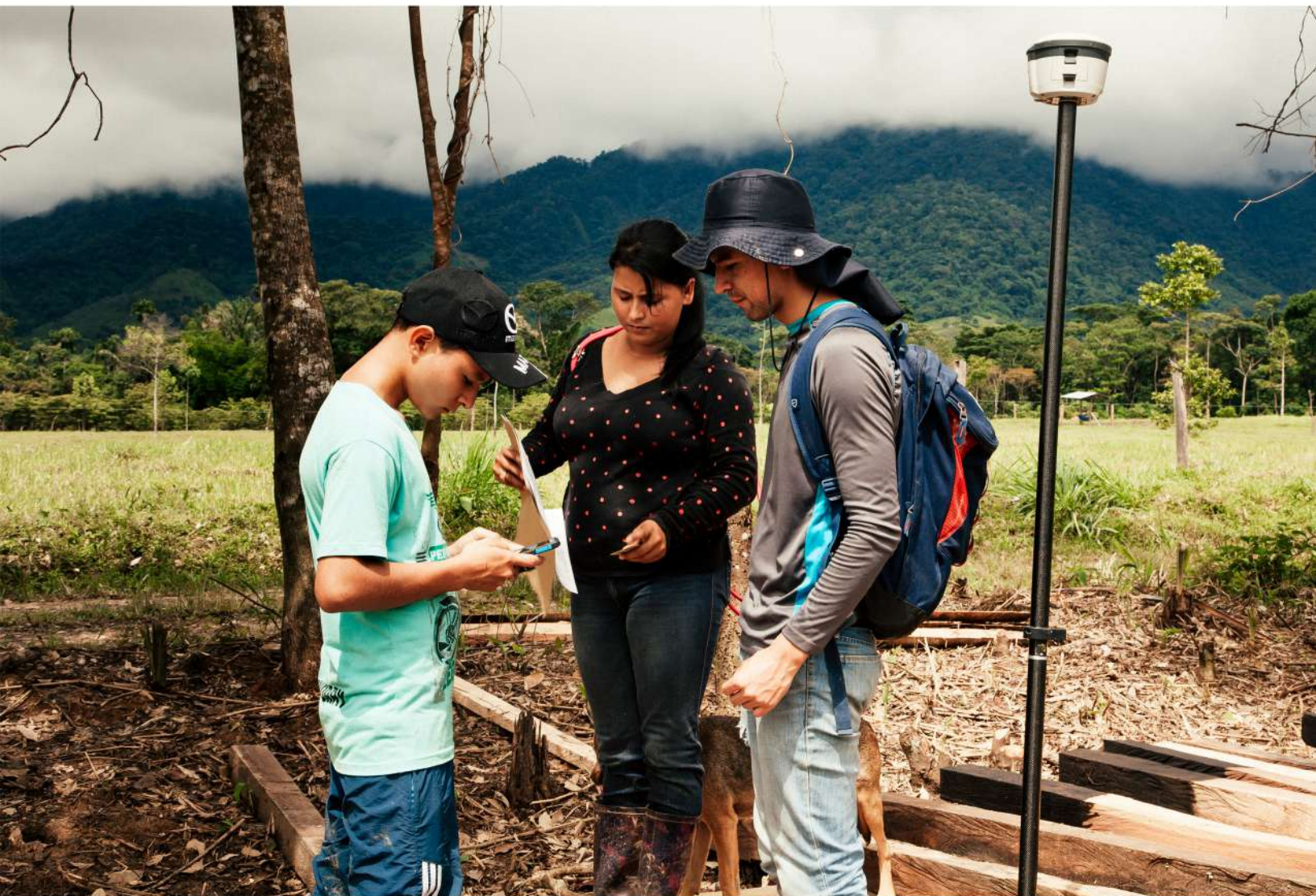
Imagen 1 Estudiante de la Universidad Distrital entrenando a un joven local para la recolección de datos con la metodología FFP. Vista Hermosa, 2018.

La esencia de la metodología FFP radica en que el dueño u ocupante de la propiedad rural, junto a un joven de la vereda encargado de la medición de los predios, camina los linderos con un GPS y una aplicación móvil recolectando de una forma integrada, basada en el modelo LADM, los datos físicos, legales y administrativos del predio y los datos personales del propietario. Cuando los datos de la vereda entera se han recolectado y procesado se presentan a la comunidad para su aprobación en una Inspección Pública, evento organizado por las autoridades catastrales. Ahí, con la participación de la comunidad, quienes están aplicando por derechos de propiedad se declaran de acuerdo o en desacuerdo con los límites y su localización. Este acuerdo se registra de manera pública con firmas y huellas digitales. En todos los momentos de la metodología se busca la participación de las mujeres.