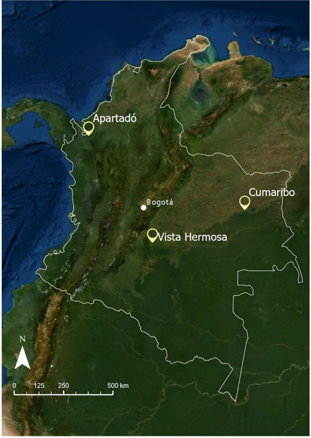
Municipios piloto en Colombia