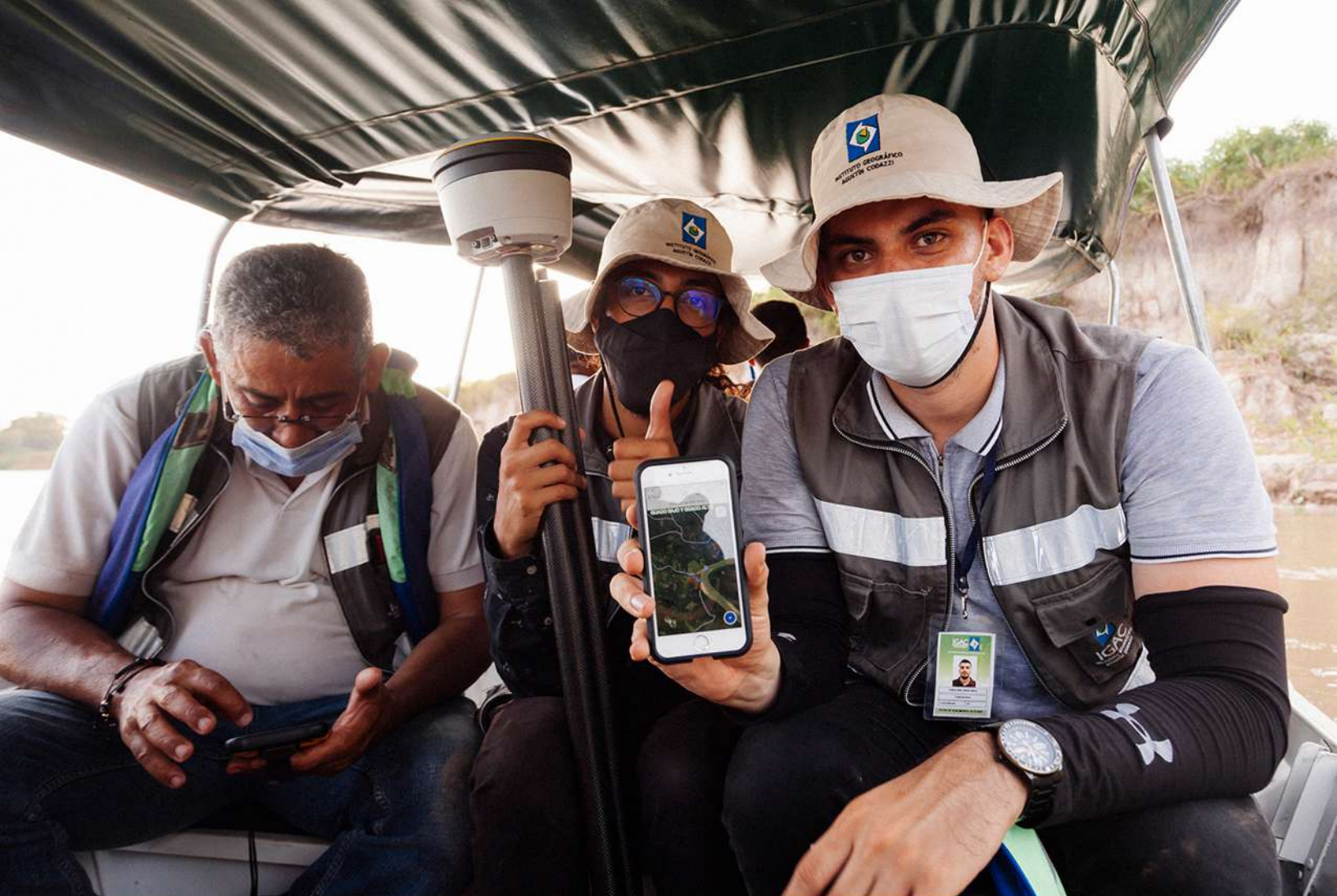
Imagen 8 Equipo local del IGAC usando la metodología FFP para recolectar información en el resguardo Guaco Alto. Cumaribo, 2020.