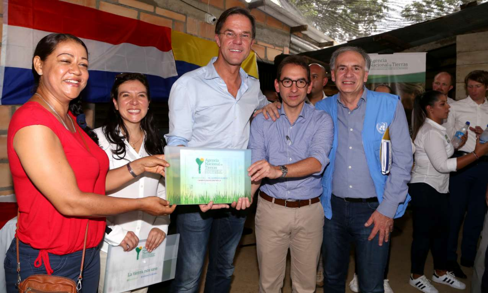
Imagen 9 Directora de la ANT, Primer Ministro de los Países Bajos y Ministro de Agricultura entregando títulos a beneficiarios. Apartadó, 2018.

El proyecto ha sido mencionado en diferentes ocasiones por la prensa internacional, colombiana y de los Países Bajos. Después del primer piloto la metodología ha sido descrita en varios periódicos y videos e imágenes han sido usados en materiales de comunicación de instituciones colombianas.