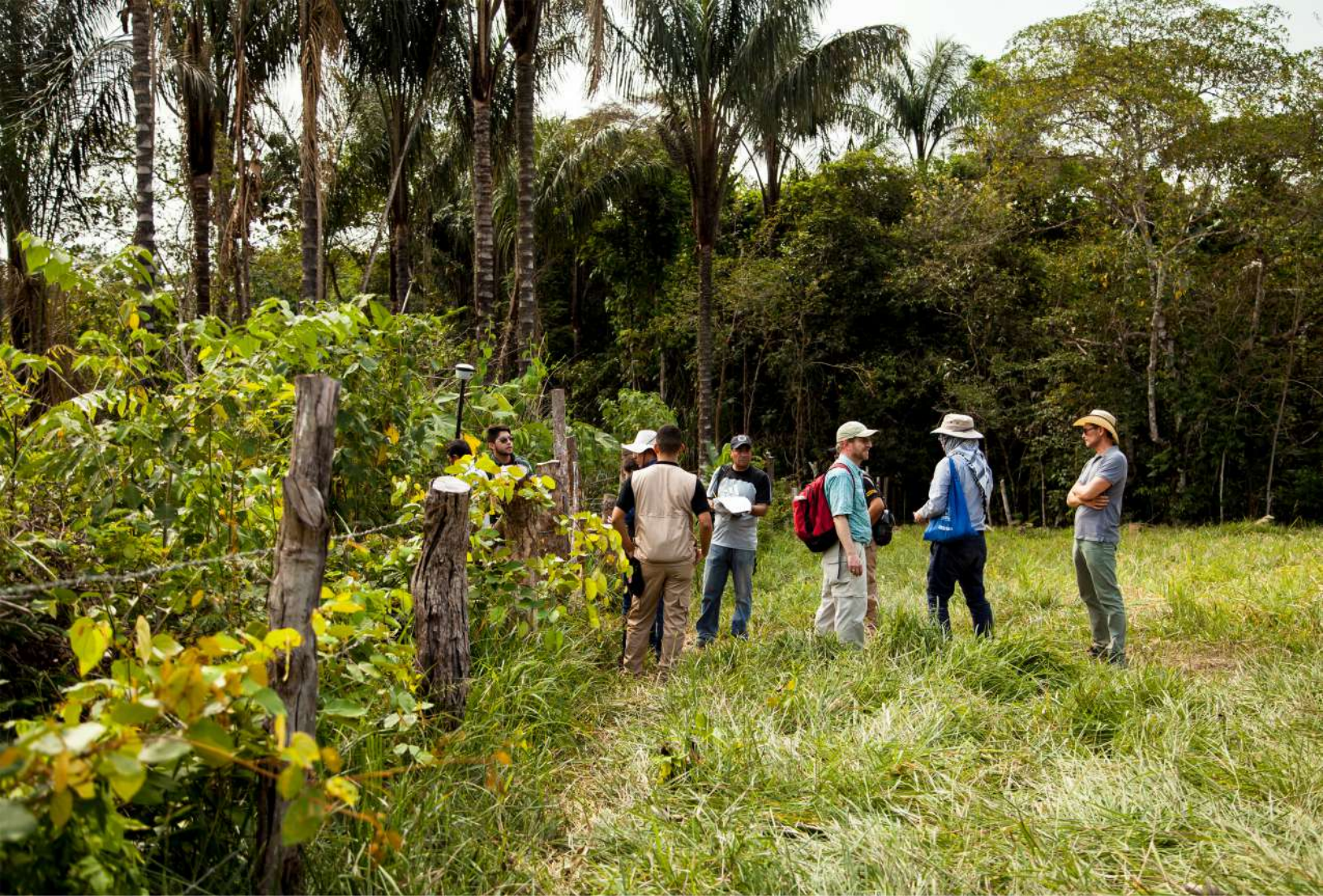
Imagen 3 Probando la metodología FFP durante el primer pre piloto en cooperación con la Universidad Distrital, ANT, IGAC, SNR y DNP. Vista Hermosa, 2018.

En la fase de testeo, incluyendo contratiempos e imprevistos, se midieron 44 parcelas en Termales y 42 en Los Mandarinos, en ambos casos casi el 60% de la vereda. Las condiciones físicas del terreno fueron bastante complicadas para la medición.